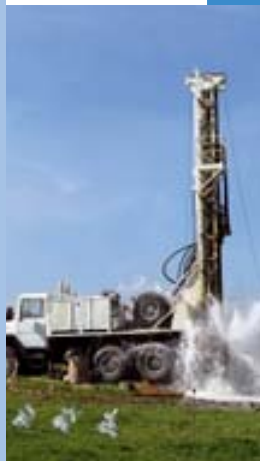
Forage d'eau